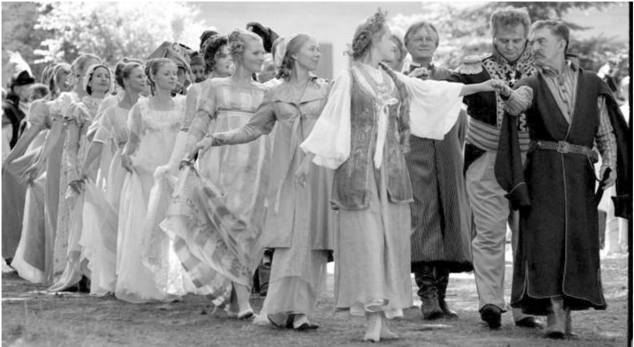
Fragment filmu Pan Tadeusz , 1999 r., reż. Andrzej Wajda

1. Do podanych dawnych nazw tańców dopisz ich ogólnie przyjęte współczesne odpowiedniki. Nazwy zapisz w mianowniku liczby pojedynczej.