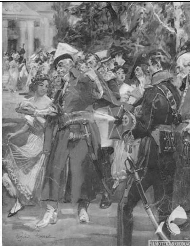
Wojciech Kossak, Polonez z "Pana Tadeusza" , 1928 r., olej, plakat.