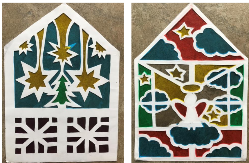
2 pav. Mokinių sukurtų vitražų pavyzdžiai