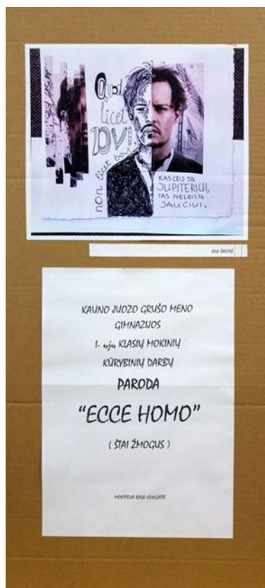
5 pav. Mokinių parengtas parodos plakatas

5 užduotis. Eksponuoti kūrinius Nakvynės namų suteiktose erdvėse, fiksuojant procesą foto ir video priemonėmis bei pagal situaciją išklausant jų gyventojų ir personalo refleksijas.