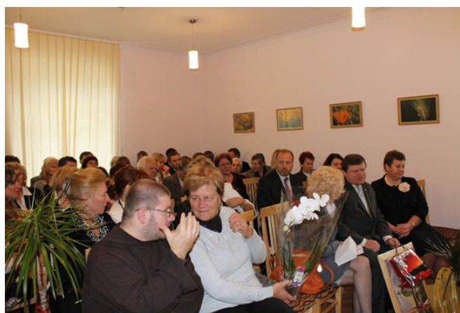
6 pav. Parodos eksponavimo vieta Kauno Nakvynės namų erdvės

5 užduotis. Eksponuoti kūrinius Nakvynės namų suteiktose erdvėse, fiksuojant procesą foto ir video priemonėmis bei pagal situaciją išklausant jų gyventojų ir personalo refleksijas.