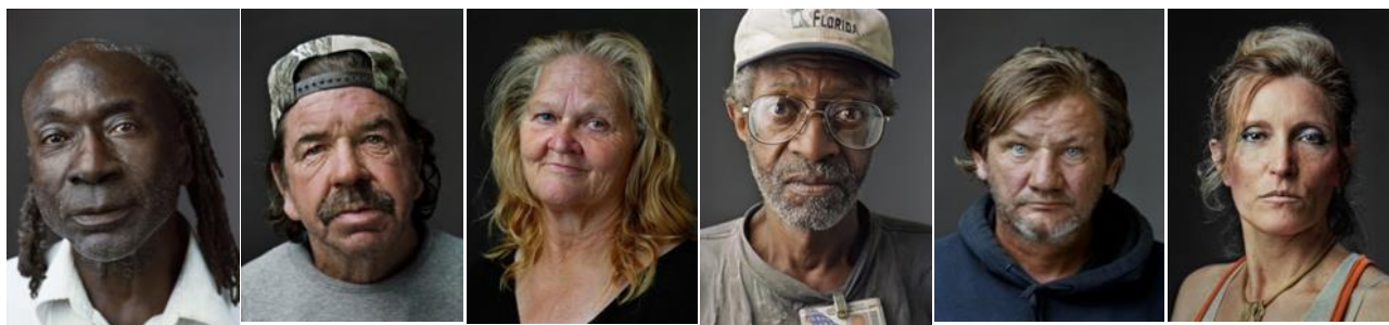
3 pav. Mokinių surasta vaizdinė medžiaga: Jan Bonning, Niujorko benamių portretai