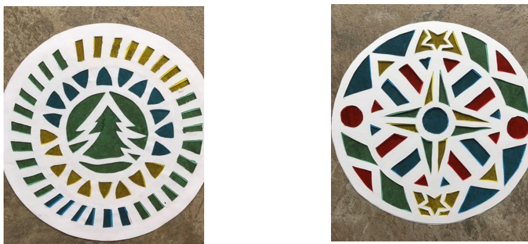
2 pav. (tęsinys). Mokinių sukurtų vitražų pavyzdžiai