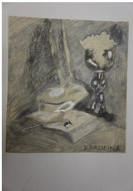
8 pav. (tęsinys). Mokinių piešiniai

Pamoka užbaigiama darbų aptarimu ir klasės sutvarkymu.