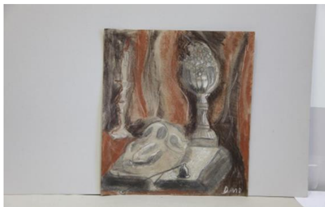
8 pav. Mokinių piešiniai