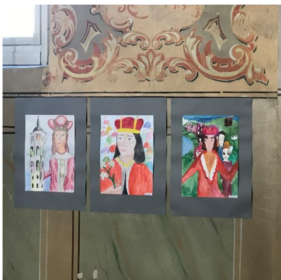
1 pav. Paroda „Šventasis Kazimieras – jaunimo globėjas“ eksponuojama Panevėžio Kristaus Karaliaus katedroje

4 pamoka. Piešinio užbaigimas, eksponavimas, aptarimas, įsivertinimas.