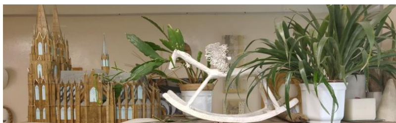
7 pav. Grafikos kabinete ant visų spintų laikomi stebėjimo ir vaizdavimo objektai sudaro natūralius natūrmortus.