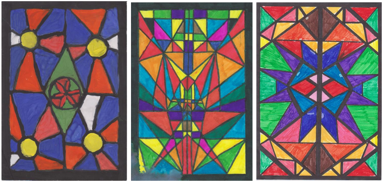
4 pav. Keli mokinių sukurtų vitražo projektų pavyzdžiai