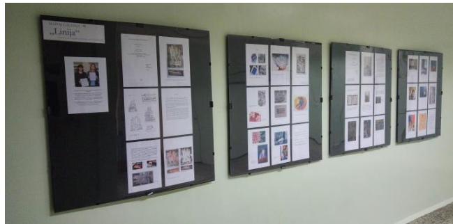
9 pav. Mažoji grafikos galerija „Linija“ prie grafikos kabineto ir retrospektyvinė ilgamečio (nuo 1996 m.) kasmetinio dailės projekto „Dovana mokyklai“ paroda – standai I aukšto fojė, kur mokinių kūrybą gali apžiūrėti mokyklos bendruomenė ir svečiai.