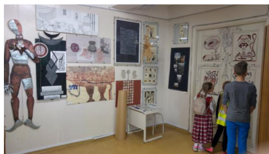
8 pav. Nematyti įrengimai, grafikos ir kitokių menų kūriniai, „Apmąstymų“ stalelis po plasnojančiu angelu domina ir skatina visa tai išbandyti pačiam.