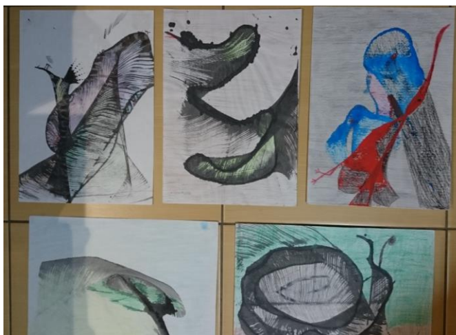
2 pav. Šliaužiančio siūlo pėdsakai lape

Sėkmės įsivertinimas. Mokiniais patinka jaustis svarbiais. Trys iš keturių įpareigotų mokinių sąžiningai vertino ir atsakingai atliko pavestą darbą pamokoje. Taikyta strategija atitiko lūkesčius, tačiau pasirinkti (šiuo atveju keliantys drausmės problemas) mokiniai reikalauja nuolatinio dėmesio, kartais savo įgaliojimus viršijo, todėl reikėjo nuolat priminti pareigą ir užduotį ir atsakomybę vertinant. Kartais teko slopinti, pamokos ekspertų iniciatyvą, nes elgesys viršijo įsipareigojimus. Koreguotinas „ekspertų“ elgesys, reikia labai konkrečiai ir visiškai aiškiai įvardinti pareigas.