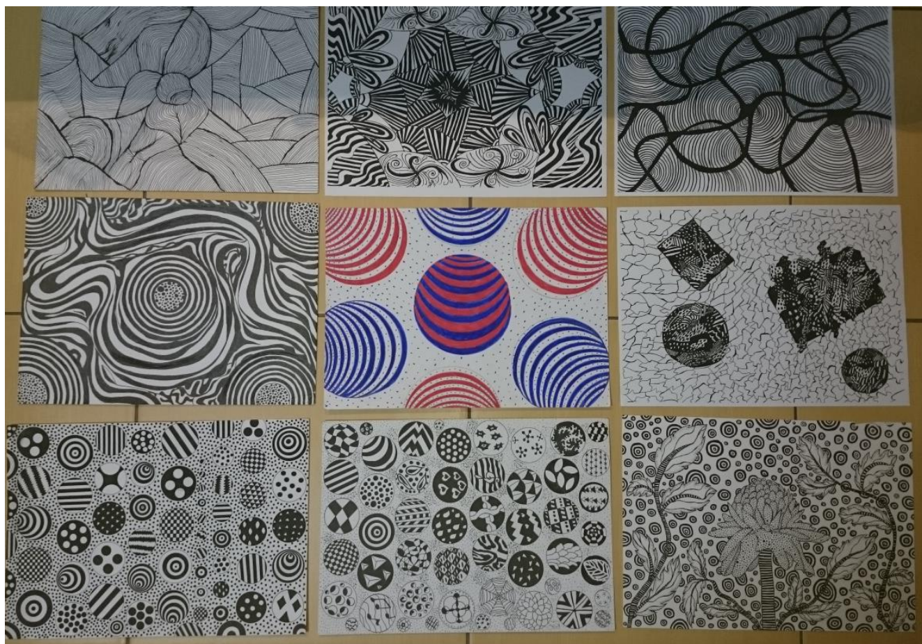
3 pav. Užduoties rezultatai – Dzen piešiniai

Sėkmės įsivertinimas. Užduočiai atlikti skirtos trys pamokos ir visą užduoties atlikimo laikotarpį taikoma aplinkos pasikeitimo strategija. Mokiniai dirbo, reiškė kūrybines mintis, labiau susitelkė darbui, keitėsi darbo priemonėmis, bendravo ir bendradarbiavo. Mokiniai galėjo stebėti vieni kitų darbą ir tuo pačiu susitelkti ties savo piešiniu. Drausmės problemų turintys mokiniai taikant aplinkos pasikeitimo strategiją buvo santūresni, drausmingesni – jautėsi labiau matomi.