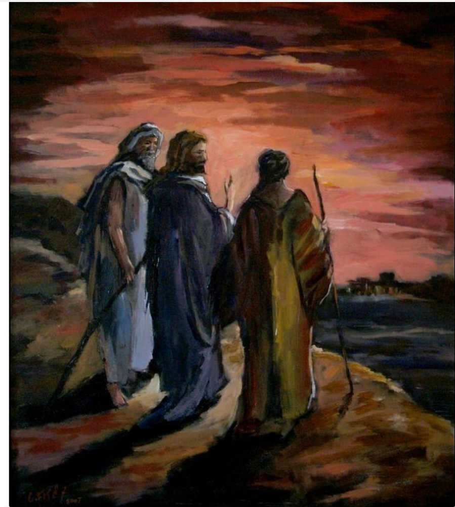
Walk to Emmaus is a painting by Carole Foret which was uploaded on December 12th, 2013.