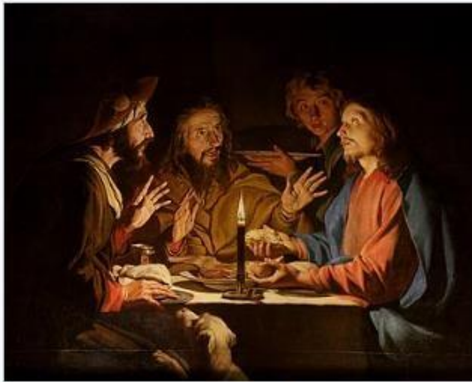
Mattias Storm: "Supper in Emmaus", 1601