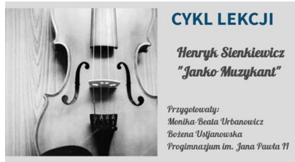
Rysunek 1. Strona tytułowa cyklu lekcji na platformie genial.ly