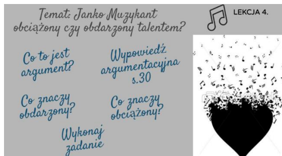
Rysunek 7. Wypowiedź argumentacyjna

Na zakończenie cyklu lekcji warto porozmawiać z uczniami na temat współczesnych form realizacji talentu. Można w tym celu wykorzystać nagrania z show „Mam talent” lub innych programów telewizyjnych, w których wynajdują się talenty.