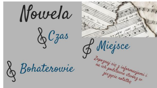
Rysunek 3. Nowela jako gatunek, świat przedstawiony w noweli

Uczeń w trakcie pierwszej lekcji poznaże życiorys i twórczość autora, oglądając filmik „H. Sienkiewicz życie i twórczość” (czas trwania 4:42); zapoznaje się z pozytywizmem jako epoką, jej realiami i przyswaja treść „Janka Muzykanta”. W końcu lekcji, aby utrwalić zdobyte wiadomości, wykonuje zadania interaktywne w learnigapps – „prawda czy fałsz” oraz układają plan wydarzeń. Po zakończeniu zadania ma możliwość samooceny i weryfikacji błędów. Po tej części lekcji przechodzimy do określenia gatunku noweli. Uczniowie poznają cechy gatunkowe, na podstawie elementów świata przedstawionego potwierdzają, że utwór „Janko Muzykant” jest nowelą. Wykonują samodzielną notatkę w zeszycie.