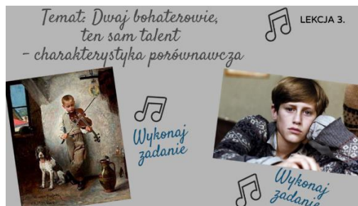
Rysunek 6. Charakterystyka porównawcza bohaterów