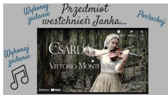
Rysunek 4. Przedmiot westchnień Janka...(zadanie dodatkowe)

Temat drugi: (1-2 lekcje) „Był jak skrzypki z gonta” – co wiemy o Janku Muzykancie? Lekcję rozpoczynamy od przyswojenia terminów „gont” i „muzykant”. Platforma genial.ly odsyła do słownika języka polskiego PWN, uczeń wykonując dwie umiejętności: podaje znaczenie wyrazów oraz kształci nawyk pracy ze słownikiem. Podstawowym celem lekcji jest charakterystyka głównego bohatera w oparciu o kartę pracy. Osiągnięcia ucznia to: praca z tekstem, dobór odpowiednich cytatów, wzbogacania słownictwa. Zebrane informacje i wiadomości zostaną wykorzystane w dalszej pracy z lekturą. Uzupełnieniem tematu jest kolejny slajd zatytułowany „Przedmiot westchnień Janka...”