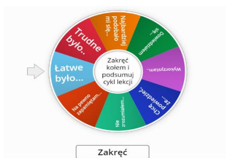
Rysunek 8. Refleksja na platformie wordwall

Cykl lekcji poświęconych analizie i interpretacji noweli „Janko Muzykant” kończymy refleksją na platformie wordwall.