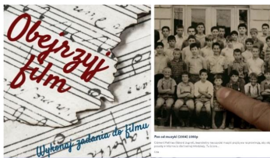
Rysunek 5. Zadanie domowe film „Pan od muzyki”

Kolejny slajd „W drodze po marzenie...”, w zależności od dysponowanego czasu, może być wykorzystany jako podsumowanie i ewaluacja, praca samodzielna lub domowa. Na zakończenie lekcji zadajemy slajd „Obejrzyj film”, gdzie znajduje się link do filmu „Pan od muzyki” oraz karta pracy – raport z kina. Dla wnikliwych uczniów nowy termin – retrospekcja.