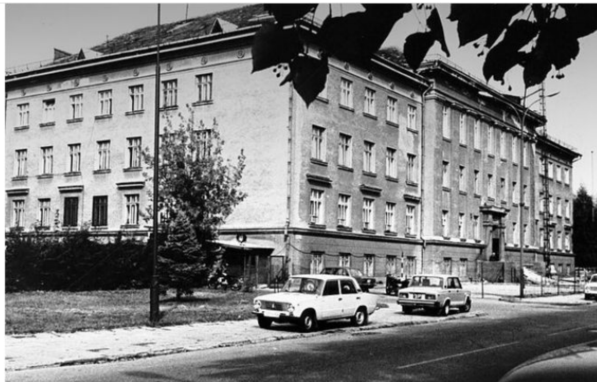
LRT pastatas

https://www.kvb.lt/lt/krastieciams/gallery/210-marvos-dvaras