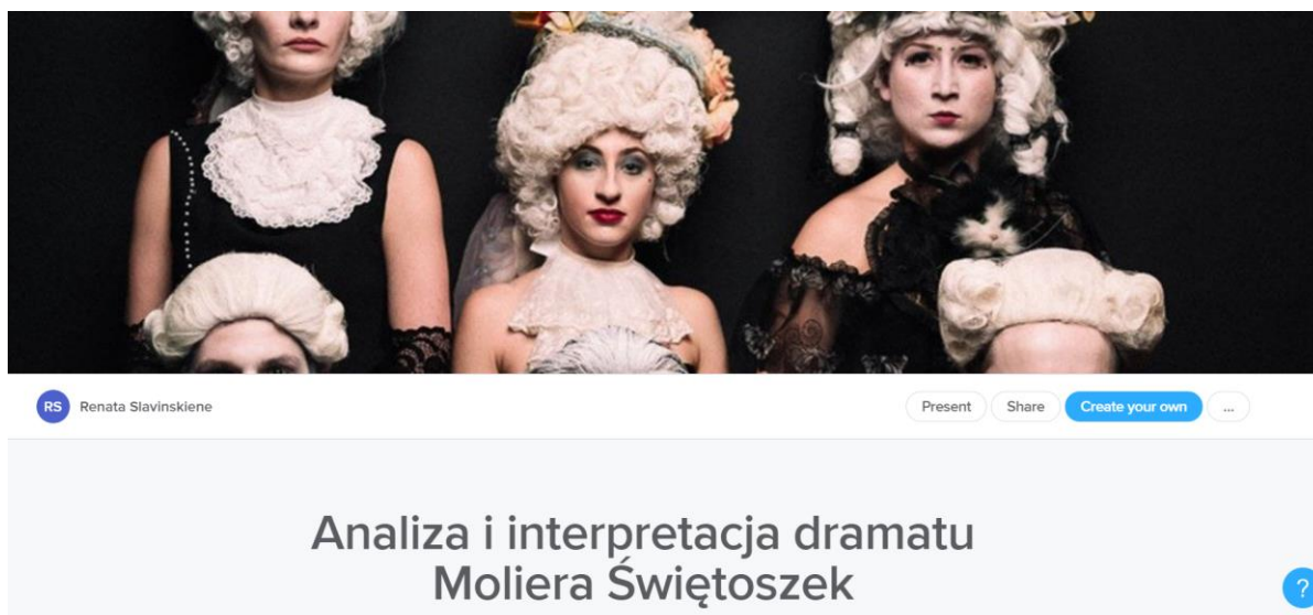
Rysunek 1. Strona tytułowa cyklu lekcji na platformie Sutori.com

Podczas pierwszej, wstępnej lekcji poświęconej analizie i interpretacji dramatu Moliera Świętoszek nauczyciel zapoznaje uczniów z materiałem zamieszczonym na stronie Sutori.com, kryteriami sukcesu dla uczniów.