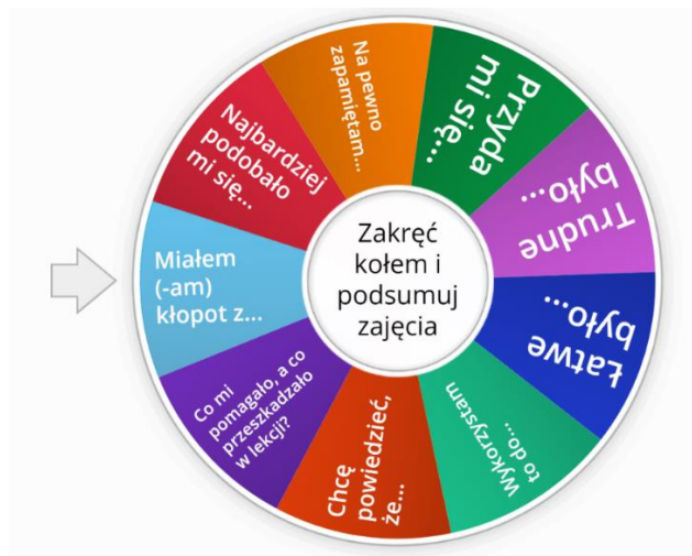
Rysunek 11. Refleksja na platformie Wordwall