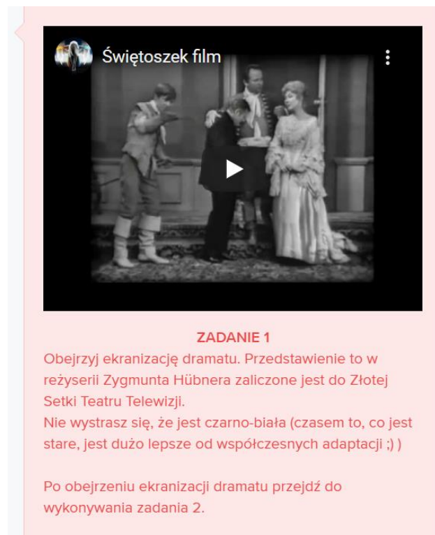
Rysunek 3. Zadanie 1

Po przeczytaniu dramatu i zapoznaniu się z biografią Moliera i ciekawostkami z jego życia uczniowie mają zadanie domowe – obejrzeć ekranizację dramatu w reżyserii Zygmunta Hübnera zaliczone jest do Złotej Setki Teatru Telewizji.