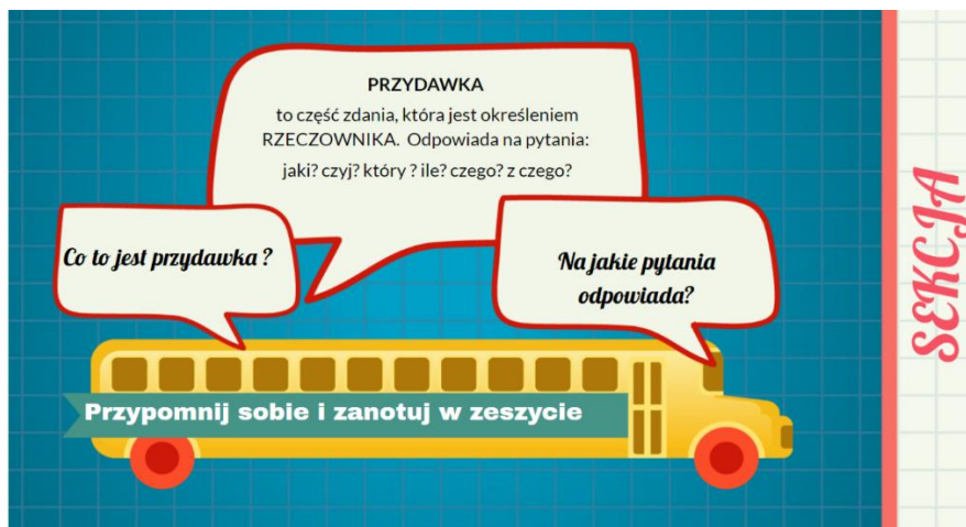
Rysunek 2. Definicja przydawki.

4. Następny slajd przedstawia schemat przydawki i części mowy jakimi może być wyrażona przydawka.