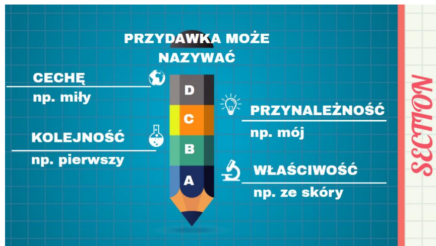
Rysunek 4. Przydawka może nazywać.