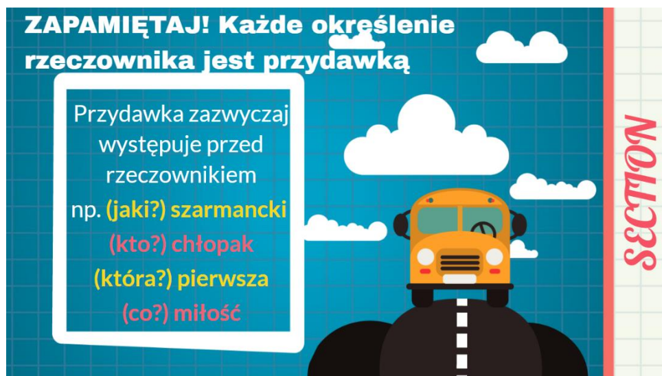
Rysunek 5. Związek przydawki z rzeczownikiem.