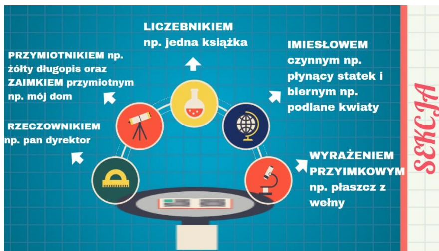
Rysunek 3. Przydawka – sposoby jej wyrażania.

4. Następny slajd przedstawia schemat przydawki i części mowy jakimi może być wyrażona przydawka.