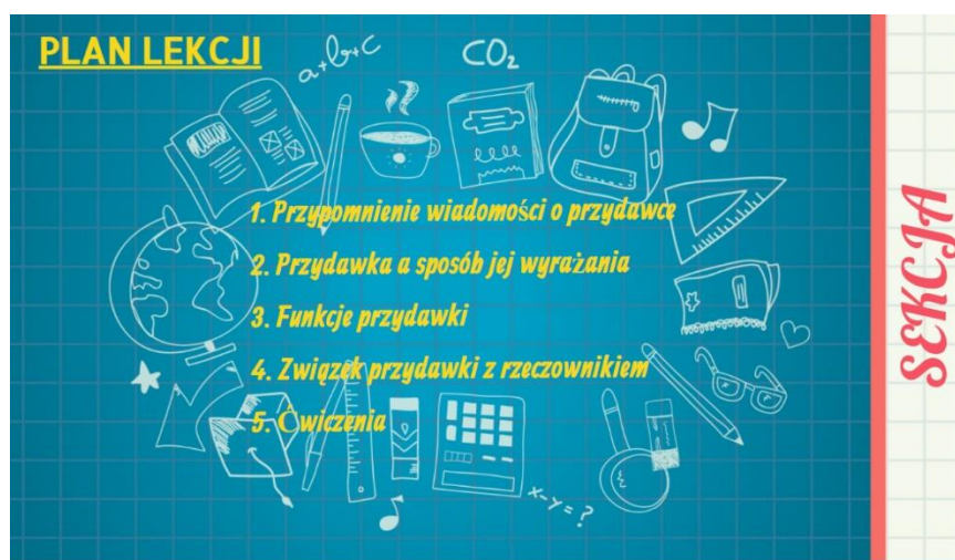
Rysunek 1. Plan lekcji.