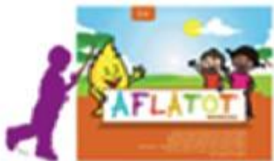
AFLATOT 3- 6 metų

Socialinių/gyvenimo įgūdžių ugdymas Finansinio raštingumo ugdymas Švietimas apie pragyvenimo šaltinius