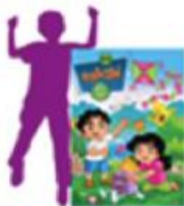
AFLATOUN 6 - 14 metų