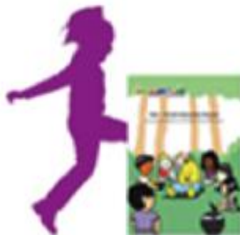
AFLATOUN NU 6 - 14 metų