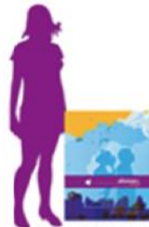
AFLATINAS 15 + metų