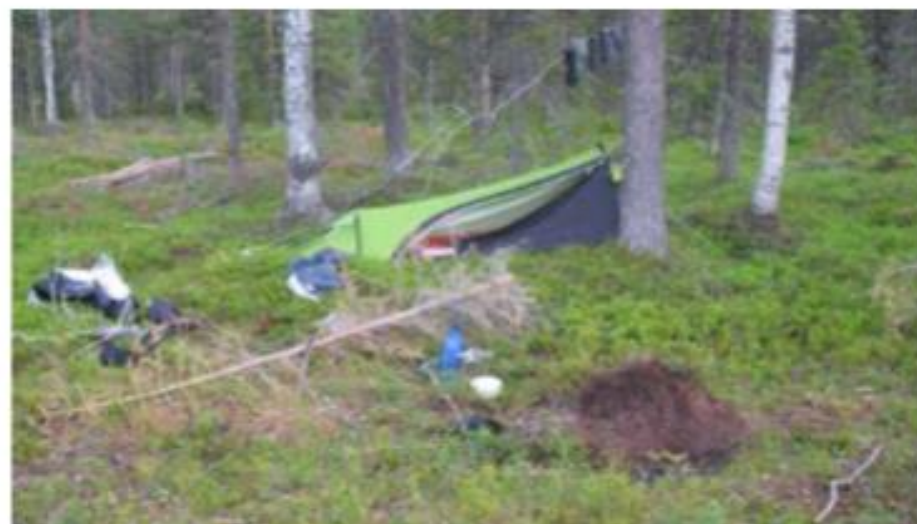
Rytas (6:11 val.).

Kol kas nenaudojau turimų vaistų, tepalo nuo uodų, nors nakvynėje jų buvo nemažai. Galėjau iš karto užmušti penkis. Tai, aišku, toli nuo vieno grąžo [grąžas – žygeivių varto-