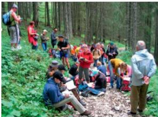
Paskaita Julijos Alpėse Slovėnijoje, 2007 m.

08.00 Puntizėla–Postoinos urvas ( Postojnska jama ), 138 km (3 val.). Vienuoliktasis praktikos rytas dažniausiai prasidėdavo atsiveikiniu su paatogrąžiais, nors pakeliui į Slovėniją dar sustodavome tyrinėti raudonžemių ir paatogrąžių augalijos. Pirmosios kelionės metu čia susidūrėme su keista pasienio problema. Įvažiuojant į Slovėniją paaiškėjo, kad esa-