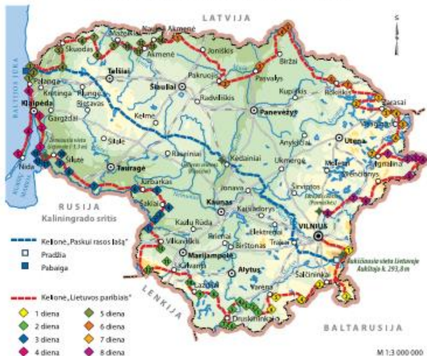
Kelelė „Paskui rasos lašą“ ir „Lietuvos paribiais“ kelias.