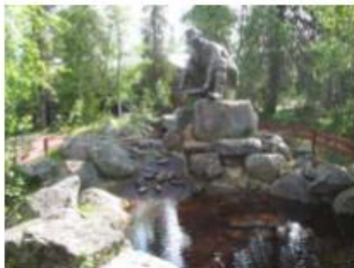
Paminklas auksio plovėjams Tankavaroje.