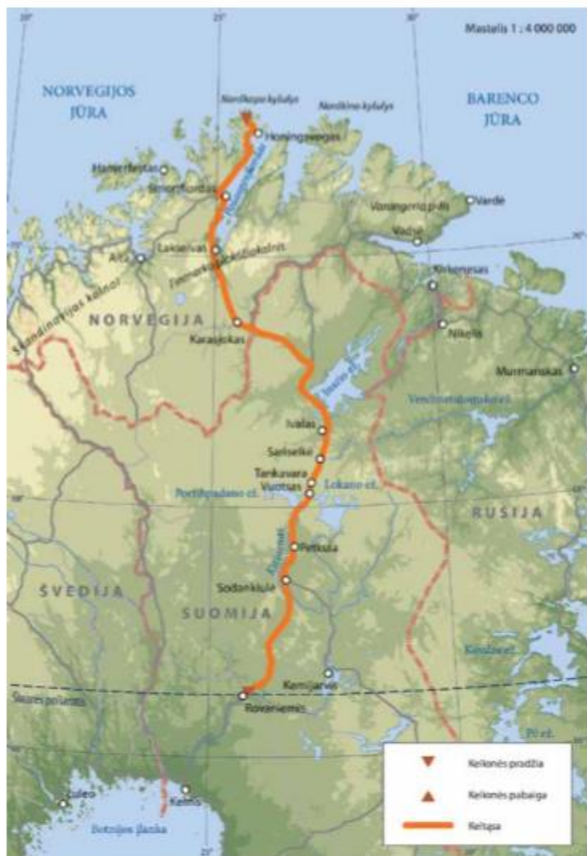
Kelionės ilguoju Europos meridianu keltąsa