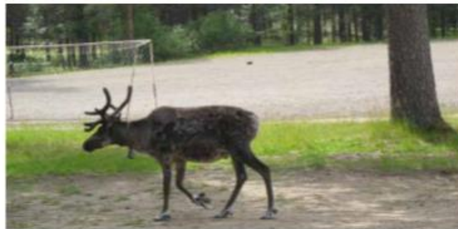
Sauvės elnias Tankavaroje.

Vakar ar šiandieną eglynų taigą vėl keičė pušynai. Jie ten, kur upių terasos, smėlynai.