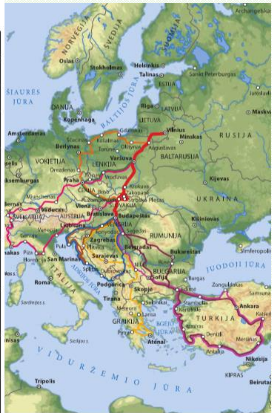
*Tolimųjų praktikų keltos.

Ar turite savo svajonių keltą? Ne? Tai paruoškite!