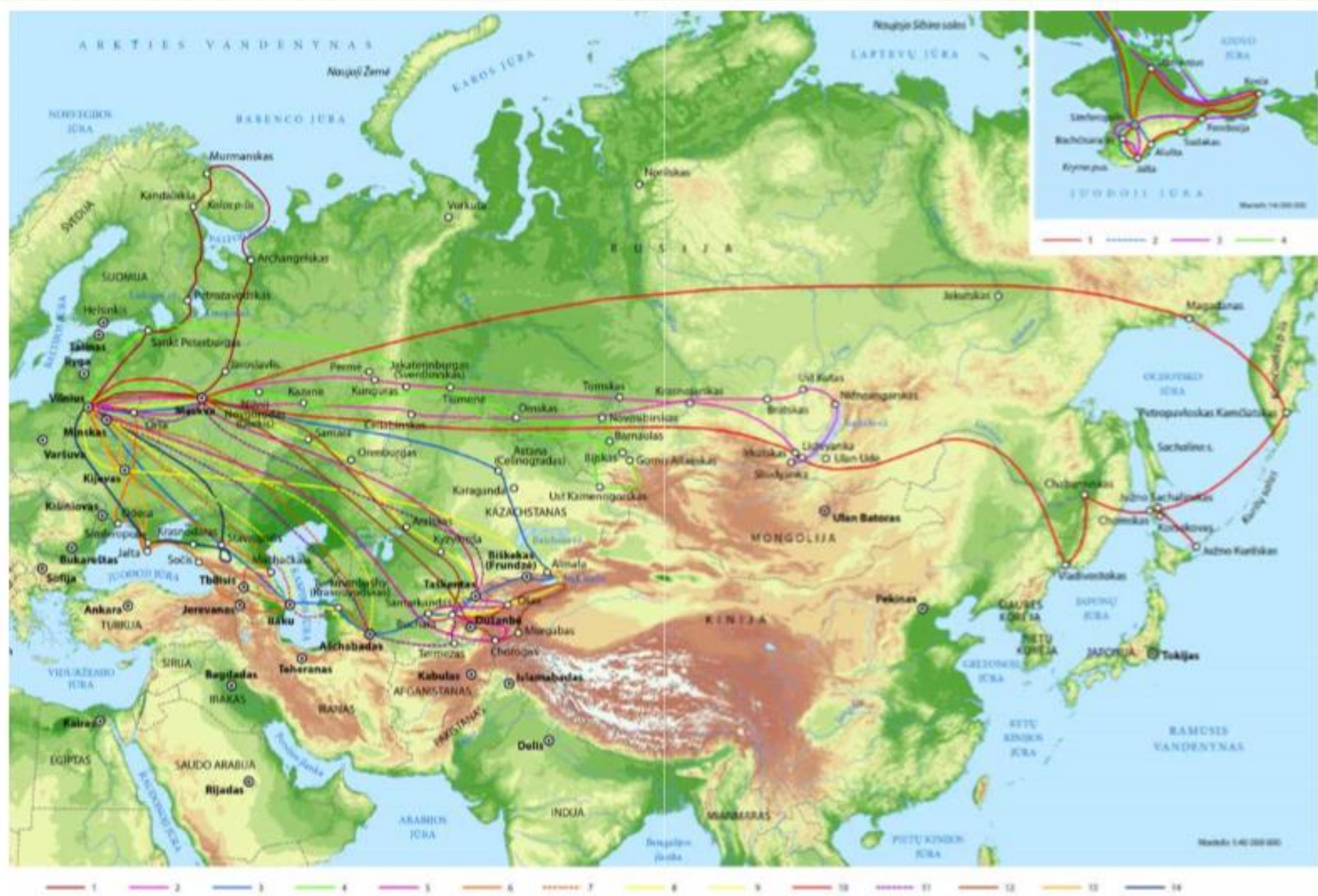
Tolimųjų praktiky ir JGM ekspedicijų kėlposos