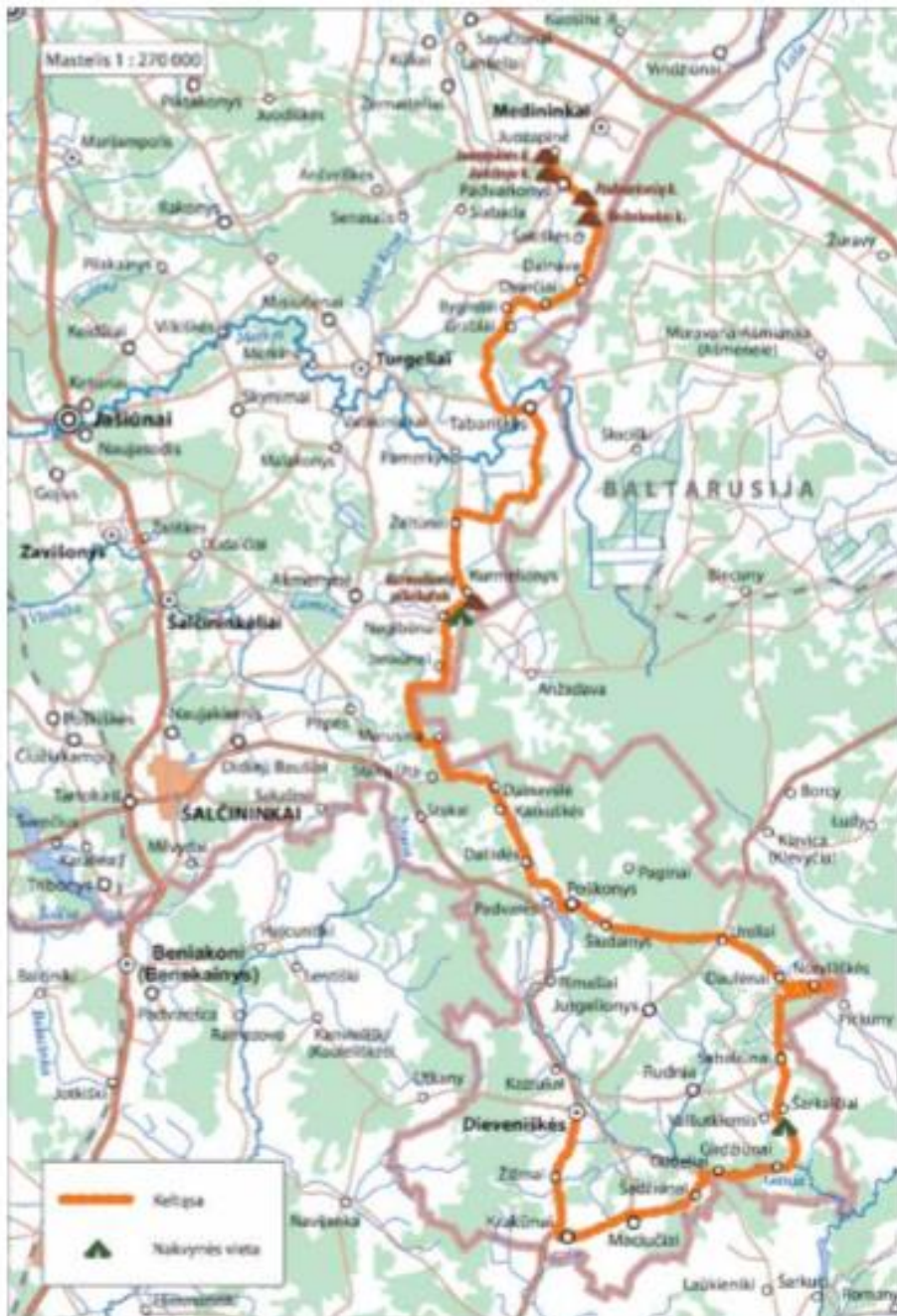
Kelionės aplink Lietuvos kėlęsa.