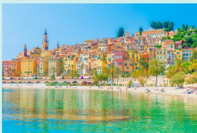
Prancūzijos Rivjera arba Žydrasis krantas