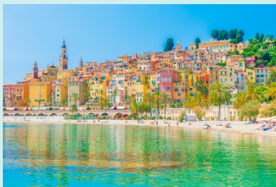
Prancūzijos Rivjera arba Žydrasis krantas