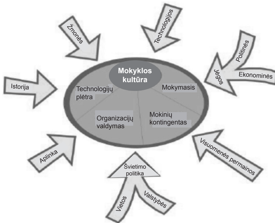
1 pav. Mokyklos kultūros formavimasis (pagal: P. Dalin, G. Rolf, B. Kleekamp, 1999)

Svarbiausi mokyklos kultūros aspektai – turinys ir forma. Mokyklos kultūros formą sudaro kultūros narių tarpusavio santykių modeliai ir jungimosi į grupes formos. Mokyklos kultūros formą galima nustatyti pagal mokytojų ir bendruomenės narių santykius, pavyzdžiui, ji gali būti individualistinė arba antagonistinė. Mokyklos kultūros formos įkūnija kultūros turinį. Keičiantis bendravimo su kolegoms formoms ir grupių susidarymo modeliams, gali kisti ir mokytojų įsitikinimai, požiūriai ir vertybės (Hargreaves, 1999).